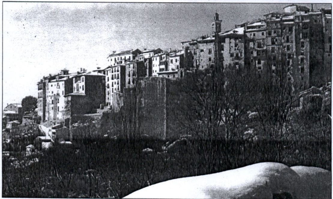
"Cuenca para mí es una ciudad fantástica porque parece en fondo de los que ha pintado Leonardo da Vinci"